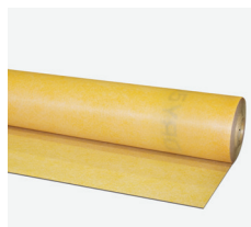
Lámina multicapa de impermeabilización para espacios exteriores de hasta 7 m 2 e interiores