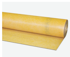
Lámina multicapa de impermeabilización de espacios exteriores de hasta 15 m 2 e interiores